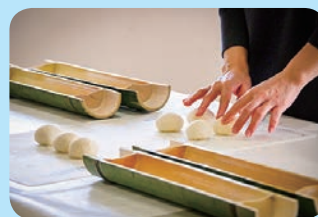
◀パン生地をこねて竹筒で二次発酵させる