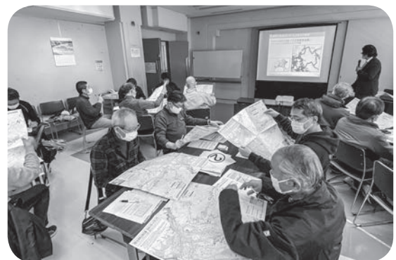
▲ワークショップを行う参加者