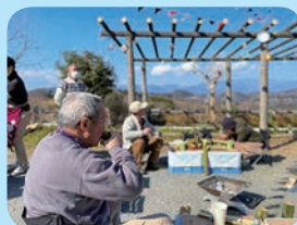
▲「かつぼ酒」を嗜む男性

竹筒に地酒を注いでお燗して嗜む『かつぼ酒』と、和BBQではヤマメの焼干しで炊き上げた竹筒ごはんや、竹を鍋にした酒粕のつみれ鍋。洋BBQは、竹筒でパンを焼き、竹鍋チーズフォンデュを堪能しました。