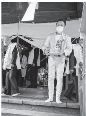
▲本殿から福豆をまくスベリー