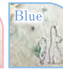
ピンクはくまの刺繍 ブルーはいぬの刺繍