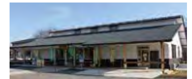
「四季の里」所在地:大井町柳265