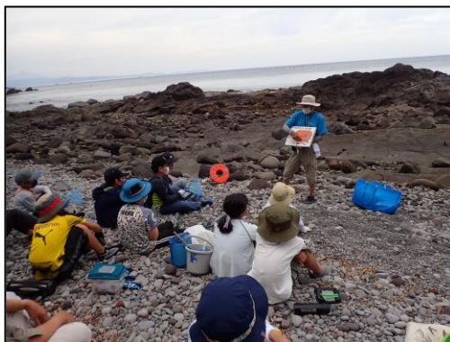
磯の観察での諸注意を聞く。