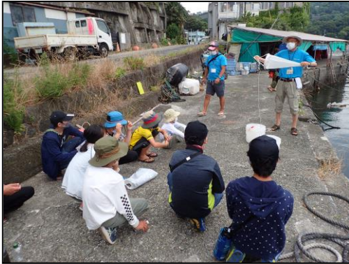
岩漁港でプランクトン採集を行う。