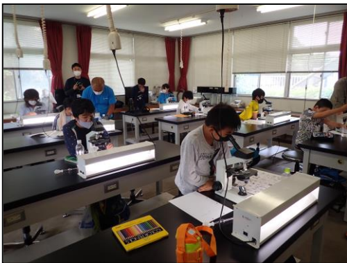
プランクトンを検鏡し、スケッチする。