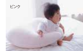
「ピンク」と「ブルー」からお選びいただけます。

ふんわりと柔らかいポリエステルわたと立体メッシュ生地により、ハンモックのように優しく赤ちゃんの頭を受け止めます。中素材が取り出せるので、向き癖・絶壁防止、成長に合わせて高さを調節しご使用いただけます。洗濯可能なのでいつでも清潔、安心です。