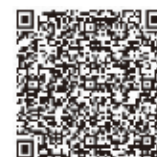
▲令和7年度 町県民税申告

〈送付先〉〒258-8501 足柄上郡大井町金子1995番地 大井町役場税務課 宛