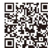
▲令和6年分 確定申告特集