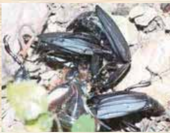
カブトムシの死体を食べる様子

オオヒラタシテムシは、自然のなかで死体を処理して土に戻してくれる大切な役割を担っている虫のひとつです。林に住むそうじ屋さんと言ってよいかもしれません