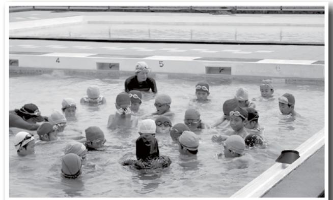
みんなのレベルが上がりました