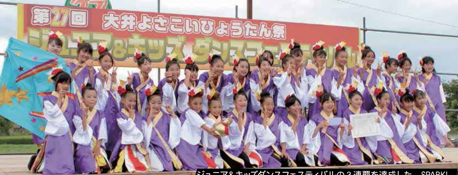
ジュニア&キッズダンスフェスティバルの3連覇を達成した SPARK!