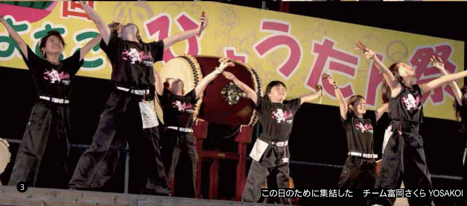
この日のために集結した チーム富岡さくら YOSAKOI