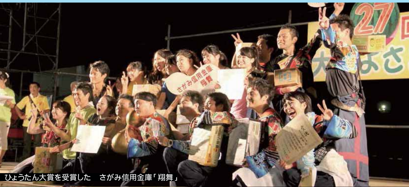
ひょうたん大賞を受賞した さがみ信用金庫「翔舞」