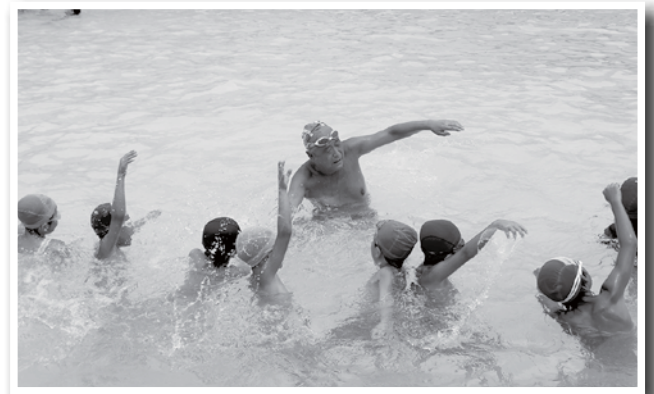
手はこうやって動かします