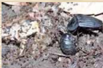
親子で仲良く食事中的 オオヒラタシテムシ