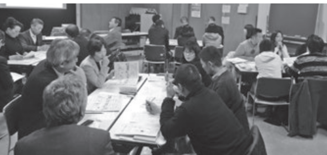
昨年度は、PTAと教育委員会との懇談会を2回開催しました。