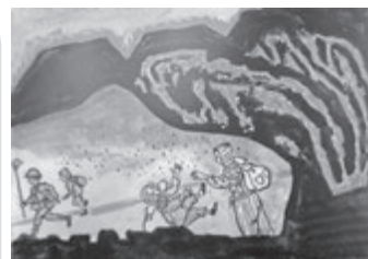
『戦争とけん一』 昭和60年神奈川県立図書館 「第6回手づくり紙芝居コンクール」 奨励賞受賞

戦後70年の節目の今年、紙芝居を通じて、戦争を知らない世代へ継承していく一助になることを心から願います。