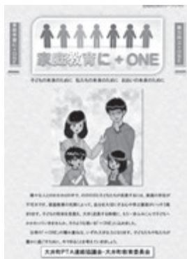
※リーフレットは町のホームページでも公開しています

この2つの観点から大切だと考えられることをページごとにとまとめ、簡条書きで示しています。各ページ上部にはPTAの皆様の言葉を、下部には教育委員会からのアドバイスを記載しています。 「子どもがスマホに夢中になりすぎて…」 「きまりやルールを伝えるよい方法は…」 「子どもがスマホに夢中になりすぎて…」 「きまりやルールを伝えるよい方法はない…」 など、普段の生活の中で気になることを考えるよい機会として、懇談会でリーフレットを活用していきましょうとするPTAもあります。 このように積極的にかかわっていく大人の姿を子どもたちに示すことで、地域に生きる子どもたちの成長へとつながっていくことを期待しています。