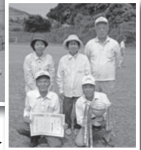
優勝した第一長寿会（市場）▶