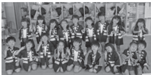
▲ 任命式で、はつぴを着ると、少しお兄さん・お姉さんになった気分です。

6月には「消防車」のお絵描き教室を行いました。消防車の周りに集まり、「前から描こうかな、横からしようかな...ここにしよう!」と自分で場所を決めていました。絵を描いている間、消防士さんが次々と消防車のドアを開けて備品の説明をしてくれて、子どもたちは興味津々。消防車の見学会が始まりました。見学に満足した子どもたちは、その後、とても集中して消防車を描いていました。