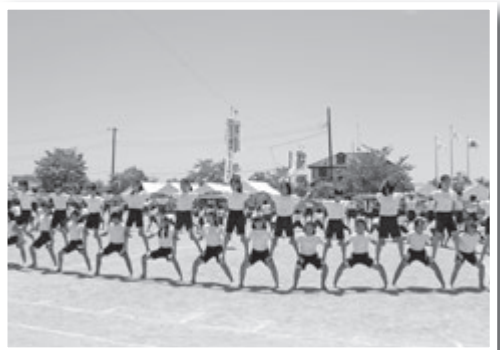
▲上大井小学校運動会