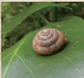
ニッポンマイマイ

昨夏、町の生きもの調査でカタツムリを調べました。調査に参加してくださった21人のデータを集計すると、全部で9種類のカタツムリを確認できました。