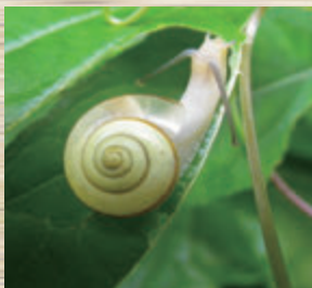
コハクオナジマイマイ

一方、相和地区にはニッポンマイマイ・ヒダリマキマイマイなどが分布し、自然度の高い地域であることが読み取れました。