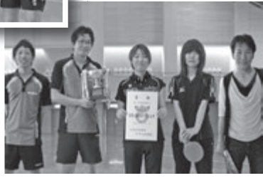
Bクラス優勝湘光中OB▶