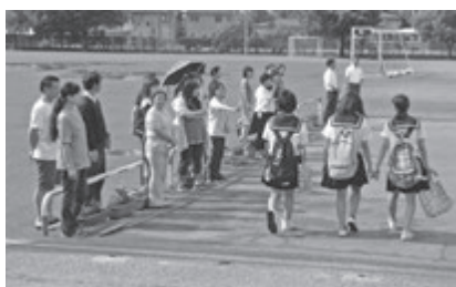
PTA主催の朝のあいさつ運動も3年目を迎えました

「おはようございます!校長先生」。毎朝校門に立ち、生徒たちの明るいあいさつに元気をもらっています。地域の方々からも中学生のあいさつにお褒めの言葉をいただいています。ごく自然に出てくるあいさつほど気持ちのいいものはありません。子ども心にそっと寄り添う、地道な活動が花開いてきました。大井町を「あいさつの町に育てていきたい」、その思いでいっぱいです。