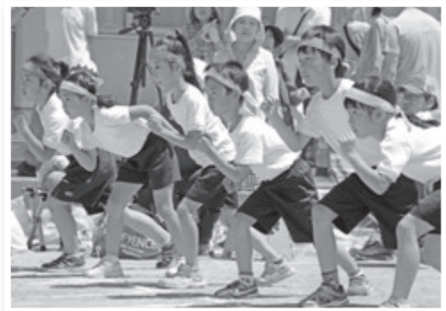
▲大井小学校運動会