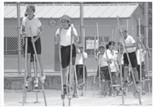
▲相和小学校運動会