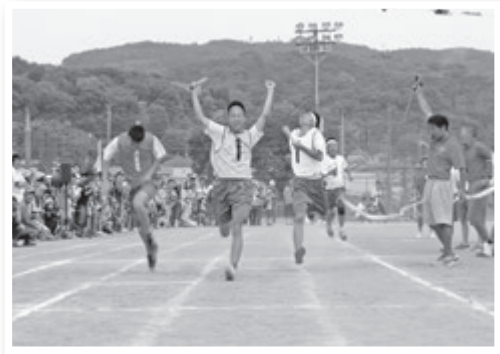
▲湘光中学校体育祭