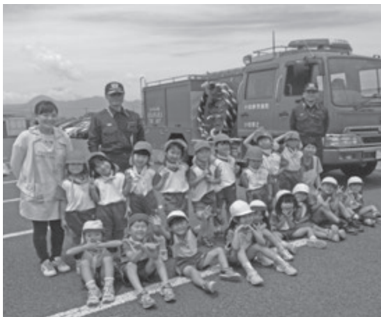
▲ 消防車!すごいね!格好いいね!大きいな!

栄光愛児園の年長「すみれ組」の子どもたちが、今年も幼年消防クラブの一員になりました。任命式には全員ではつびを着て、任命証を受け取りました。「団員の心得」お・か・し・も（おさない・かけない・しゃべらない・もどらない）をみんな復唱している子どもたちは、新たな任務に向かって頑張ろうとしているように見えます。嬉しさと照れた様子が溢れていますが、どこか誇らしげな子どもたちでした。