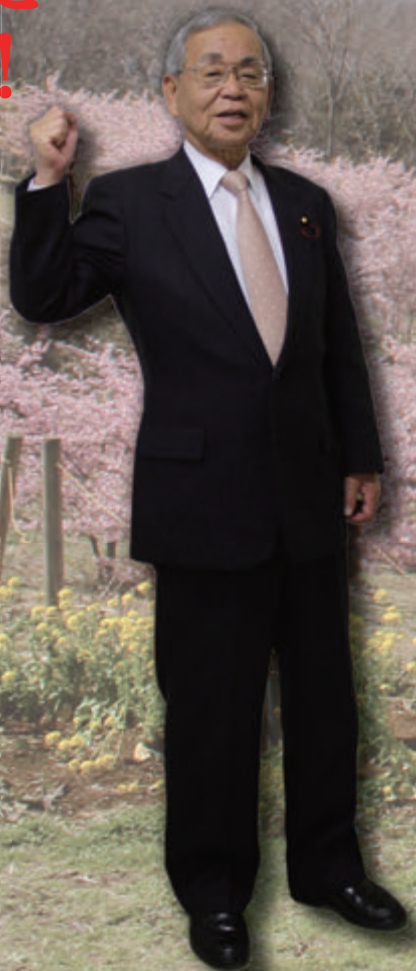
大井町議会議長 清水豊司 Shimizu Toyoshi