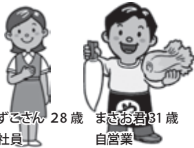
かずこさん 28歳 会社員 まきお君 31歳 自営業