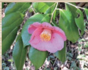
▲花卉もおしべも目立つ(篠蓮)

昆虫が少ない12〜3月に花を咲かせるヤブツバキは、花粉をメジロやヒヨドリなどの小鳥に運んでもらうという生き残り戦略をとっています。筒状になったおしべにたくさん黄色い花粉をつけ、奥にはたっぷりと蜜を用意し、その真ん中にめしべがあります。蜜を求めてやってきた鳥の嘴(くちばし)を見てみると、その基部に生えている毛に花粉が付いているのを見かけます。鳥がさまざまツバキの花を巡っていくことで受粉され、結実へとつながっていくのです。