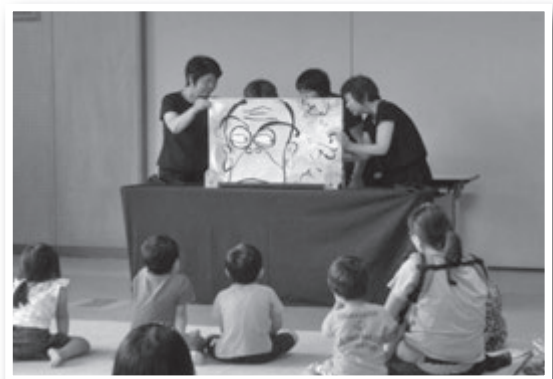
昨年7月に開催した「夏のおたのしみお話し会」