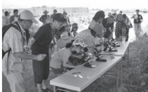
▲顕微鏡で花粉を観察

9月には、今回植えた苗の収穫体験があります。豊かな実りを楽しみに参加者は帰路につきました。