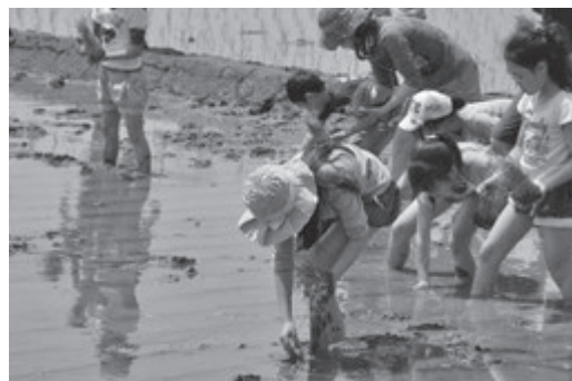
▲田んぼの感触を楽しみながらの田植え