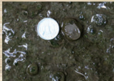
▲写真1 火山灰層中の火山豆石

火山が噴火・爆発したとき、空中に水滴があると、水滴に火山灰が付いて固まりをつくります。その豆状の粒が地面を転がりながら、すでにたまっていったさらに細かい火山灰を周りに付着させたために、層状の殻を持ち、火山豆石になったと考えられます。