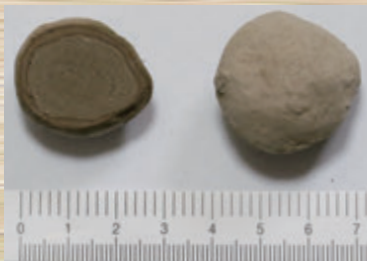
▲写真2 火山豆石の断面