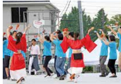
さがみ信用金庫上大井グループ