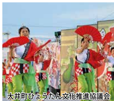
大井町ひょうたん文化推進協議会