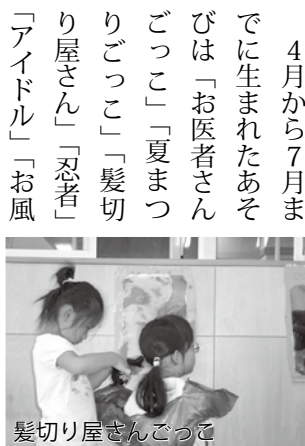
髪切り屋さんごっこ

4月から7月までに生まれたあそびは「お医者さんごっこ」「夏まつりごっこ」「髪切り屋さん」「忍者」「アイドル」「お風