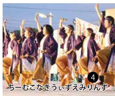
ちーむこなきういずえみりんず