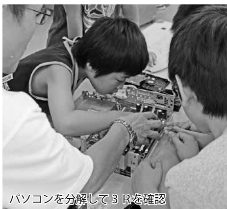
パソコンを分解して3Rを確認

8月3日(木)、8日(火)、10日(木)に町図書館で小学4,5年生を対象に「図書館員体験」を開催しました。開館準備、書籍の整理、本の貸し出しや返却、新しい本の受け入れ作業などを体験し、普段は分からない図書館の仕事の多さと難しさを実感したようでしたが、楽しみながら体験できました。