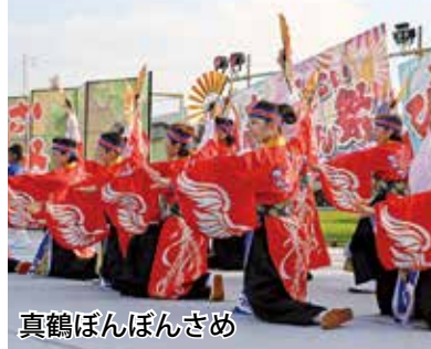
真鶴ぼんぼんさめ