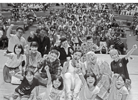
会場の皆さんと記念撮影