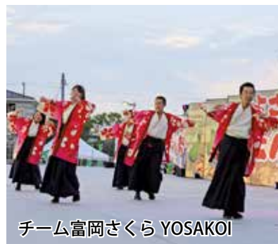
チーム富岡さくら YOSAKOI