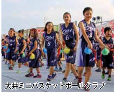
大井ミニバスケットボールクラブ