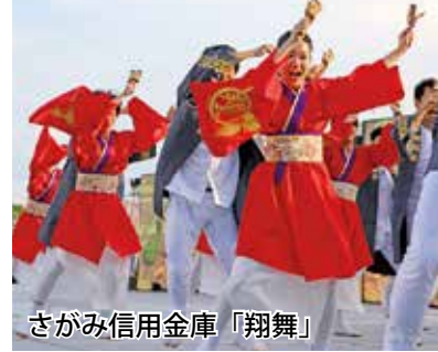
さがみ信用金庫「翔舞」