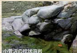
小菅沢の枕状溶岩

酒匂川の河原では、枕状溶岩のかけらがよく見つかります。枕状溶岩はどこから来たのでしょうか。川の水で運ばれてきた石ですので、酒匂川をさかのぼって探していけば見つかるはずですよ。 丹沢山地では、枕状溶岩は東側の中ノ沢(相模原市緑区鳥屋早戸川の支流)の標高900m付近に産出することが以前から知られていました。私は野外調査の中で、8年ほど前に松田町寄地区中津川上流の寄沢の河原で枕状溶岩を多数見つけました。その後、多くの方の調査により丹沢山地西側にも数多く存在することがわかってきました。松田町寄地区の水棚沢では海拔850m付近に大規模な露出があり、また、山北町玄倉地区の小菅沢橋の上流には数多くの転石が見られます。約1700万年前から、丹沢山地をつくる海底火山の噴火が起こりました。 枕状溶岩になる粘性の低い玄武岩質マグマは、海底で海水と反応しても水蒸気爆発を起こさず、練りわさびのように海底で何本も流れ出し、重なり合って固まったことが写真からわかります。