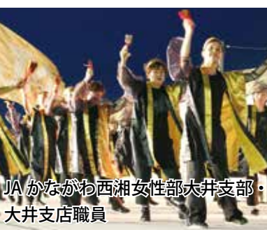
JA かながわ西湘女性部大井支部・大井支店職員