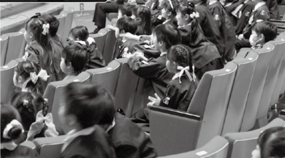
▲観劇を全身で楽しむ子どもたち