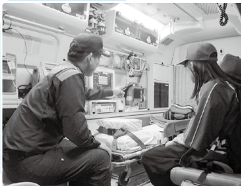
▲救急車にも乗せてもらいました！