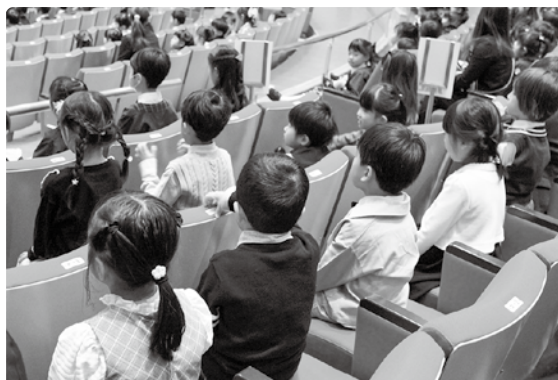
▲式典中、姿勢を正す子どもたち