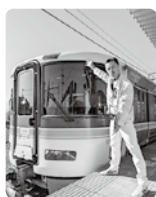
▲マルシェトレイン 御殿場 2025