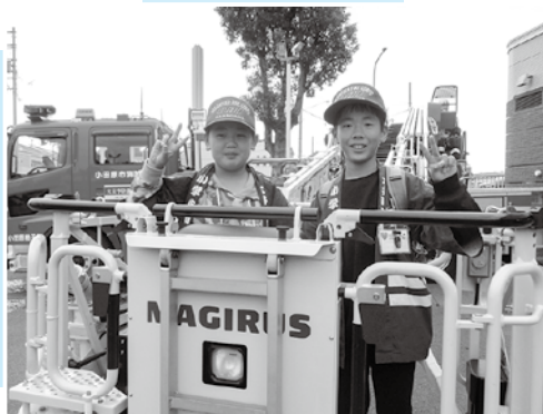
▲はしご付き消防自動車のバケットに乗せてもらいました！

また、今回はめったに経験できない「はしご付き消防自動車」のバケットに乗せてもらうことができました。そのほか消防署内の設備や救急車の中の装備など、たくさんのお話を聞くことができました。