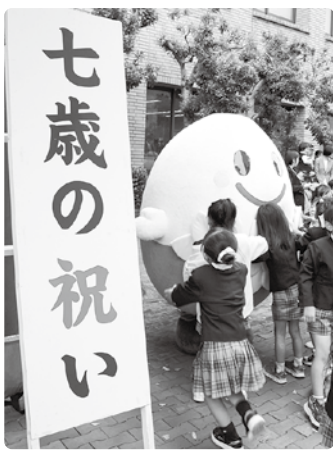
▲大人気のすいっぴー♪

式典では姿勢を正し、話を聞いたり、あいさつをしたりできる子どもたちが多く、4月の小学校入学が今から楽しみです。