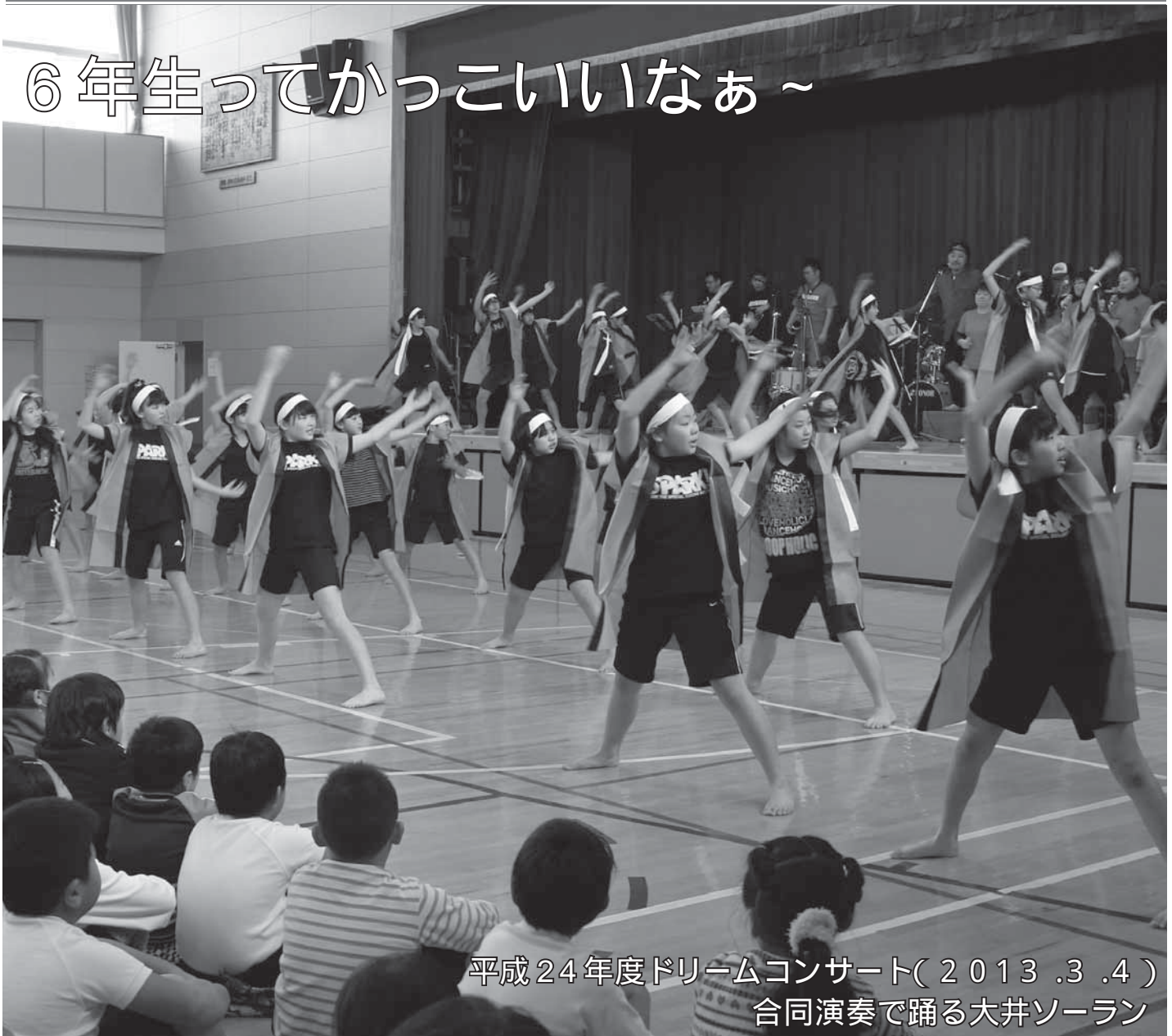
平成24年度ドリームコンサート(2013.3.4) 合同演奏で踊る大井ソーラン