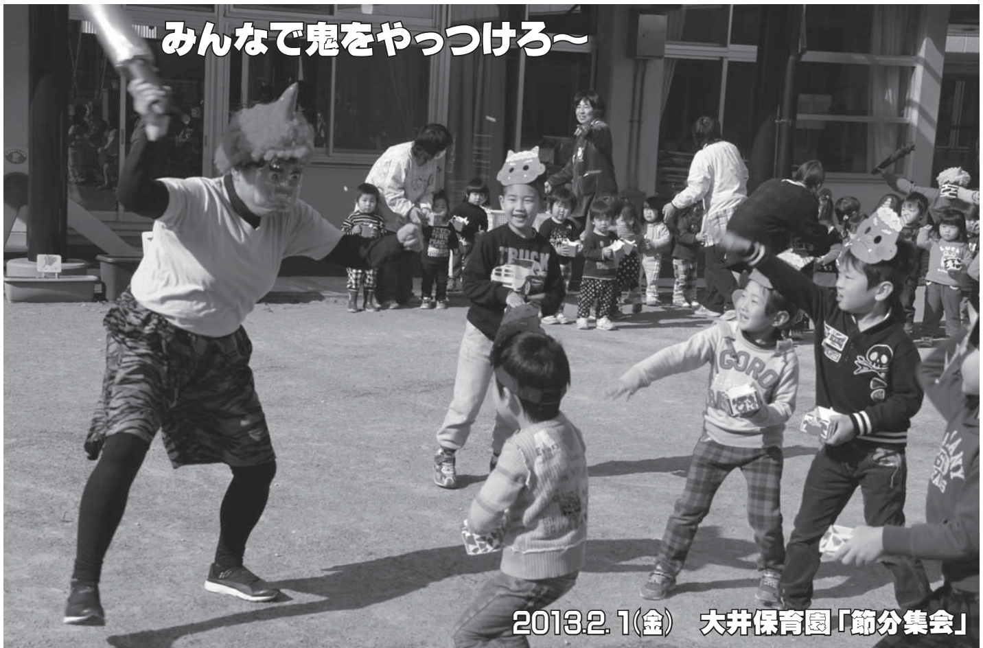
みんなで鬼をやっつけろ～