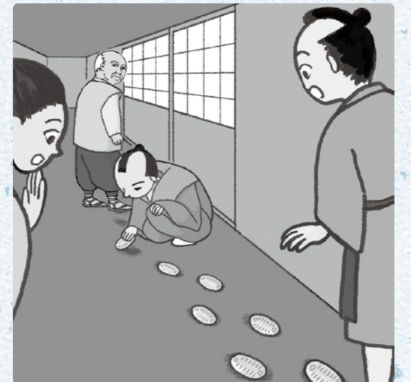
挿絵：こるり（学びおおいサポーター・町内在住） 出典：『大井町史 別編 民俗』 ※掲載スペースの都合上、一部を省略しています。

曾根家は、かつてこの地で大いに栄えた家として、さまざまな話が語り継がれています。中でもよく知られているのが、江戸の宿での出来事です。商いで出かけた主人が、鏡のように磨かれた宿の廊下を、わらじのまま部屋まで歩いてしまいました。番頭や女中が慌てて注意すると、主人は少しも気にする様子を見せず、「足跡の数だけ小判を置いて払えば、文句はあるまい」と言ったそうです。供の者が一歩ごとに小判を置いていくと、宿の者たちはあぜんとし、その豪勢ぶりに驚いたといひます。また曾根家には、大きな庭石を引かせてその上で酒宴を開いた話も残っています。その後、家が傾くと立派な朱塗りの門も持て余し、「困り門」と呼ばれたといひます。一方で、公共のために、山田から小田原へ至る道に架かる橋をすべて石橋にしたとも伝えられています。