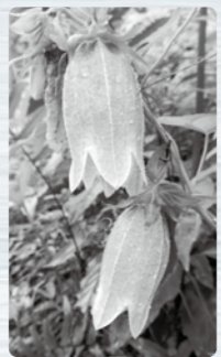
おおい自然園園長