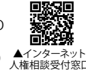
▲インターネット人権相談受付窓口

・みんなの人権 110番(全国共通人権相談ダイヤル) ☎0570-003-110 ・子どもの人権 110番 ☎0120-007-110