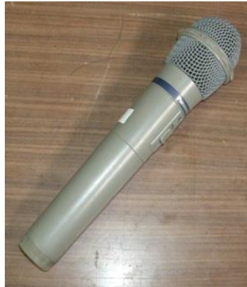
ワイヤレスマイク