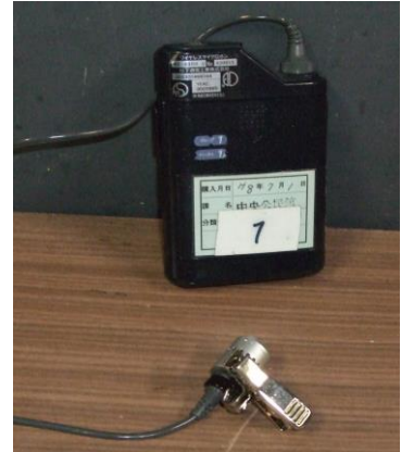
ピンマイク (ワイヤレス)