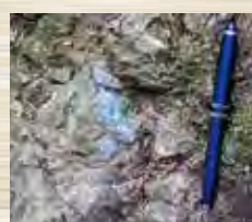
▲中央に上下方向に見られる水色の鉱物が玉髄

大井町高尾から中村川をさかのぼったところに、玄武岩の溶岩でできている「七滝」と呼ばれる滝があります（2019年3月号のこの紙面で紹介）。滝に至る沢沿いの露頭を調査していた時、滝の手前の硬そうな岩をハンマーでたたいたところ、割れた岩の断面に玉髄と呼ばれる鉱物が出現しました。玉髄は微小な石英が集まってできた鉱物で、含まれる元素の違いで白や灰、赤、緑などさまざまな色に変化します。良質のものは宝石にもなります。今回見つけた玉髄は、暗灰色の地層に水色が映えるきれいなものでした。