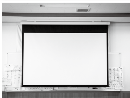
120 インチスクリーン

本年度、河原自治会では、住民が自主的に行うコミュニティ活動の促進を図り、地域の連帯感に基づく自治意識を盛り上げることを目指し、コミュニティ活動に必要な備品(プロジェクター、スクリーン)の整備を行いました。河原自治会では、今回購入したプロジェクターを使い、新型コロナウイルス感染症収束後に子ども向け映画上映会などを行うことを企画しています。また、プロジェクターの高画質化とスクリーンの大型化により、総会などでの投影資料が見やすくなりました。