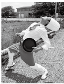
レシピが採用された 1名の方には、旬の 野菜セットプレゼン トもありますよ！

’sクッキング」のさつまいもレシピ 応募締め切りが、今月30日となつて います。もしレシピの応募が一つも なかった場合、スベリーが生ものさつ まいもをかじり倒す動画になつてし まう可能性もあるので、どうか人助 けと思ってレシピを送ってください い！よろしくお願ひします！