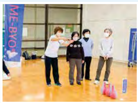
スポーツ推進委員が楽しく教えます。