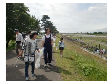
酒匂川統一美化キャンペーン