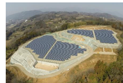
太陽光発電所「きらめきの丘おおい」