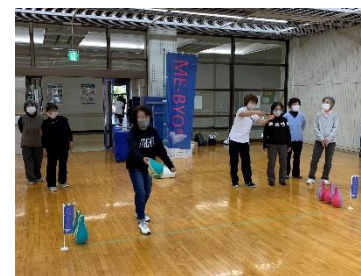
未病改善 Enjoy ニュースポーツ

持続可能なまちづくりを推進していくためには、多様なステークホルダーがそれぞれの立場を尊重し、それぞれの役割と責任のもと、対等な立場で連携・協働・協力してまちづくりに取り組んでいく必要があります。