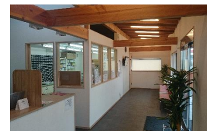
照明器具の省エネ化