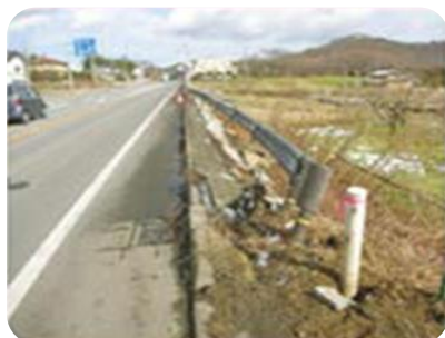
ガードレール・ 標識等の損傷