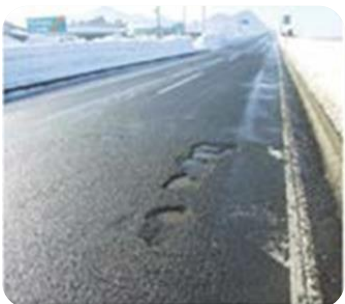
路面の穴ぼこ・ 段差